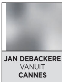
JAN DEBACKERE VANUIT CANNES

CANNES ● Om het onlinepubliek te gelde te maken, zal Twitter voortaan ook advertenties publiceren tussen de zoekopdrachten. In de toekomst kunnen de inkomsten daaruit gedeeld worden met bijvoorbeeld tv-zenders.